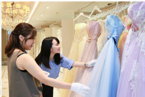
可愛いドレスがいっぱい！お気に入りの1着を