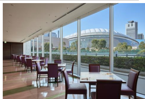
スーパーダイニング「リラッサ」店内イメージ