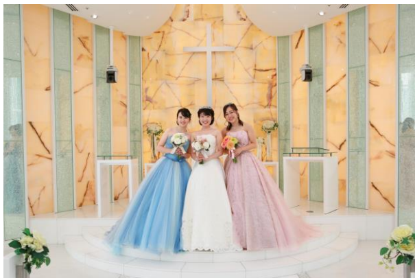
初体験！ご友人同士でチャペルで素敵な1枚を

衣裳室「フォーシス アンド カンパニー」の本場英国を中心とした上質なウェディングドレス、またはカラードレスから、お好みの1着をお選びいただけます。ドレス着用後に簡単なヘアアレンジをいたします。