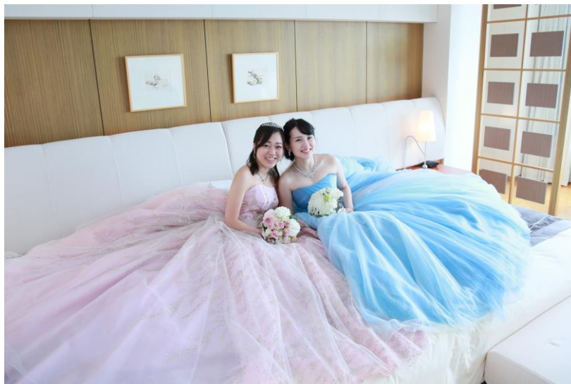
東京ドームホテル最大の広さを誇るスイートルーム「ロイヤルドームスイート」も撮影スポットに

最近、ご友人同士でSNSを投稿する機会が少なかった方におすすめ！日常に魔法がかかったような心ときめく瞬間をシェアしてください。