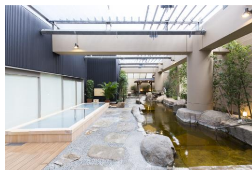
極上の癒しをご提供する天然温泉

地下1,700mから湧き出る豊かな天然温泉には、露天風呂・大浴槽のほか、様々なアトラクションバス・サウナが揃っております。さらに、各種トリートメントサロンやレストラン&カフェ、広いリラクゼーションスペースを備えたリゾート空間で、寛ぎの時間をお過ごしいただけます。