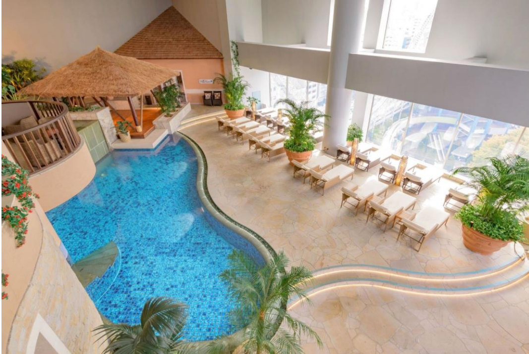
南国リゾートを思わせる広々とした空間 “ヒーリング バーデ”