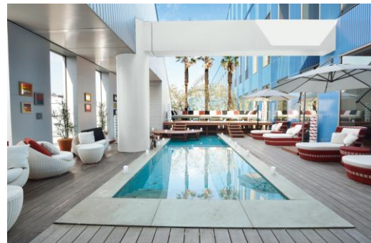
ヒーリング バーデ内：オープンデッキ

本プランではスパ ラクーア内、通常別途料金がかかる特別仕様エリア、“ヒーリング バーデ” をご利用いただけます。黄土やゲルマニウムなど、様々な岩盤浴効果が期待できる各種低温サウナや、南国リゾートを思わせる休憩スペース、ゆっくりと汗をかける低温サウナで、心とカラダのデトックスにおすすめです。