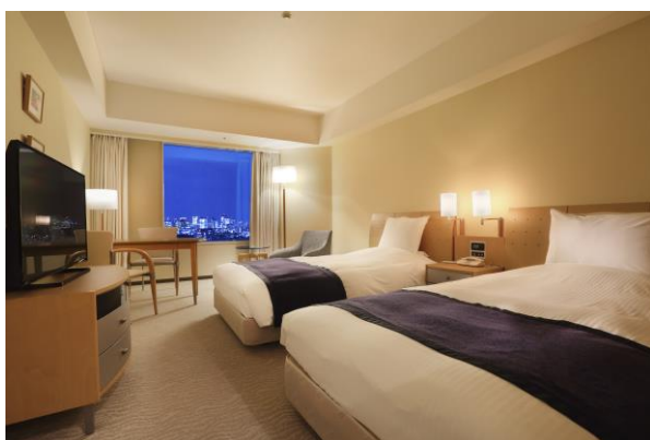
スタンダードツインルーム

モダンで温かみのある客室から見渡す東京のパノラマをご堪能いただきながら、ゆったりとした時間をお過ごしください。翌朝はスーパーダイニング「リラッサ」のご朝食で1日の始まりを。