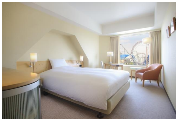
スタンダードシングルルーム