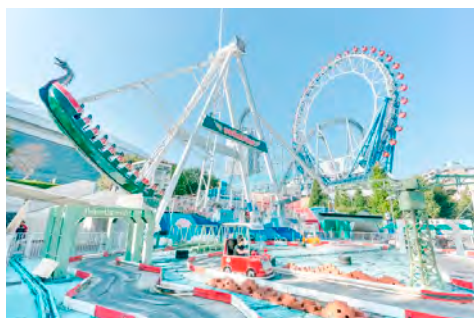
東京ドームシティ アトラクションズ

東京ドームシティを満喫できる、1 冊 10 ポイント綴りのお得なレジャーチケットです。東京ドームシティの各施設に必要なポイント数が設定されており、お手持ちのポイントを自由に組み合わせて、お好きな施設を利用することができます。