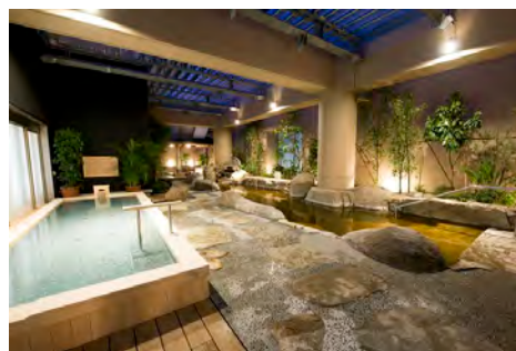
東京ドーム天然温泉 スパ ラクーア