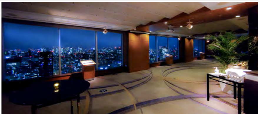
都内を見渡す特別展望ルーム

当ホテルご宿泊のお客様限定で、42F スカイバンケットを展望ルームとして開放いたします。地上 140m からの絶景をお楽しみください。