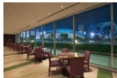
3F スーパーダイニング「リラッサ」