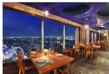
43F スカイラウンジ&ダイニング 「アーティスト カフェ」