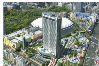
東京ドームホテル 外観

丹下健三・都市・建築設計研究所（現：丹下都市建築設計）による建物は、力強い構造フレームと柔らかな曲面が印象的なモダンなデザイン。外装には、濃淡グレーのセラミックプレートと透過性と反射性を合わせもつガラスを使用し、刻々と表情を変えていく空や都市の景色を映し出している。地下3階、地上43階の高層ビルは、高さ155m、延床面積105,856.6㎡で、客室1,006室、レストラン&ラウンジ8店、大中小宴会場18室のほか、チャペル・神殿などの婚礼施設、屋外プールなどを備えている。