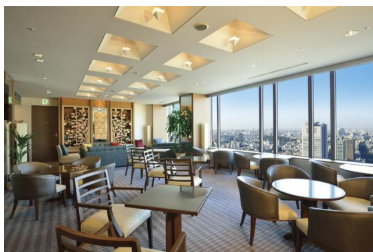
エクセレンシラウンジ