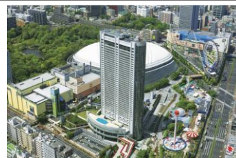
東京ドームホテル 外観

地下3階、地上43階の高層ビルは、高さ155m、延床面積105,856.6㎡で、客室1,006室、レストラン&ラウンジ8店、大中小宴会場18室のほか、チャペル・神殿などの婚礼施設、屋外プールなどを備えています。