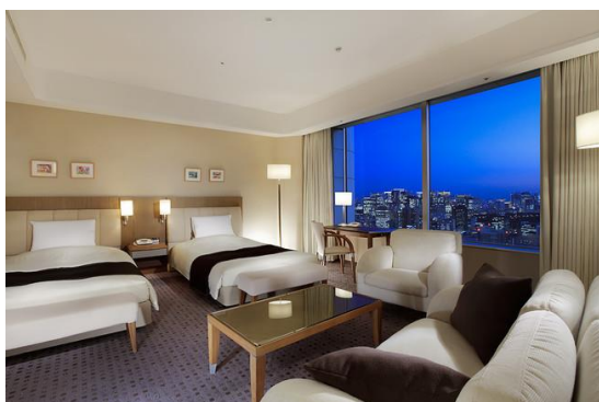
客室例：エクセレンシスイート

高層階に位置するハイグレードなお部屋で最上のくつろぎのひとときをお過ごしください。