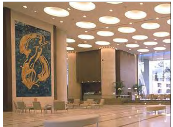
平山郁夫画伯作「平和と繁栄」

ホテルに入ってまず目にするのは、フロントカウンターと相対してアトリウムいっぱいに展示された平山画伯の「平和と繁栄」と題した陶版画です。この作品は「永遠の世界平和と民族間の深い友情を願って」制作されたもので、幅 283.5cm x 高さ 547.0cm に3人の天女が海のような懐深い空間を浮遊する様が描かれています。