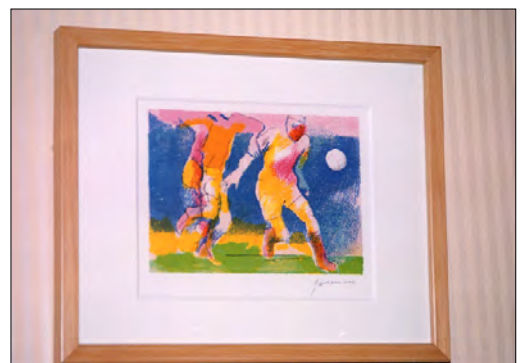
ギアマンのオリジナル作品

1006室の客室の中で、9階～22階はスポーツを、26階～38階は音楽をデザインのモチーフとしています。スポーツフロアの客室にはサッカー、テニス、ヨット、乗馬、音楽フロアの客室には弦楽器を中心としたさまざまな情景を色彩豊かに描いたギアマンの小作品が一部屋に4点ずつ飾られています。いずれも東京ドームホテルのために描かれたオリジナルで、そのあたたかな色調は客室のインテリアとも調和してくつろぎの空間を演出しています。