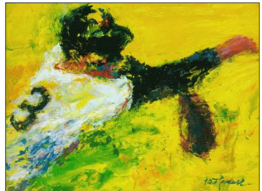
テッド・タナベ作「ミスター長嶋茂雄」

ホテルの顔とも言えるロビーの奥に並んで飾ってあるのは、テッド・タナベ作の「No.1王貞治」と「ミスター長嶋茂雄」と題したサイン入りリトグラフ。スポーツアーティストのタナベ氏が描く現役時代のおふたりの絵は躍動感に満ちています。宴会場へのエスカレーター前という、比較的目立たない場所に展示されていますが、隠れたフォトスポットとして人気を集めています。