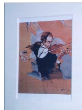
クロード・ワイズバッシュ の作品