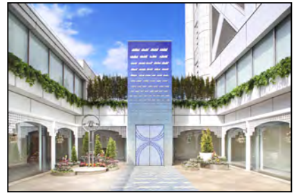
パティオは白石齋氏作「翻る地表」

また、光のチャペルで挙式をあげたカップルがフラワーシャワーの祝福を受ける隣接の祝福のパティオは、白石齋氏の「 ひとし 翻る ひるがえ 地表 だいち 」と題した作品です。地球を覆っている地表の「土」は砂塵となって旅をします。その地表が破片となって、空や海の上に浮かんだイメージを形象化したのが本作品で、有田焼の製法を生かしたレリーフとなっています。