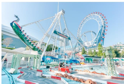
「東京ドームシティ アトラクションズ」

※スーパー戦隊ランド、期間限定アトラクションおよびアトラクション特別チケットは対象外です。