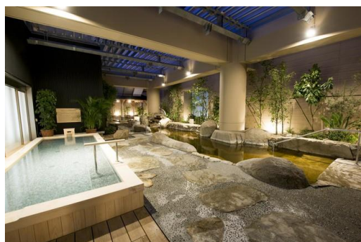
「東京ドーム天然温泉 スパ ラクア」

※スパラクア内「ヒーリングバーデ」のご利用、ご飲食、その他のサービスご利用には別途追加料金がかかります。