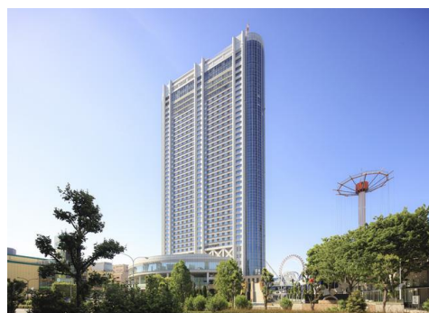
東京ドームホテル外観

地下3階、地上43階の高層ビルは、高さ155m、延床面積105,856.6㎡で、客室1,006室、レストラン&ラウンジ8店、大中小宴会場18室のほか、チャペル・神殿などの婚礼施設、屋外プールなどを備えています。