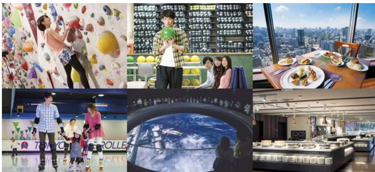
東京ドームシティをまるごと満喫 イメージ

※【本プラン限定】：得10チケット10ポイントで「リラッサ」のご朝食もご利用いただけます。（本プランに含まれる得10チケットのみ対象）