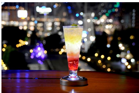
東京ドームシティ ウィンターイルミネーション コラボレーションカクテル「Winter Bright」

URL : https://www.tokyodome-hotels.co.jp/restaurants/fair/bar2000-illumination/