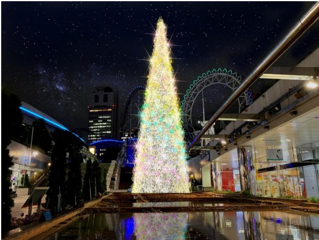
「東京ドームシティ ウィンターイルミネーション」メインツリーイメージ

関連情報 URL： https://www.tokyo-dome.co.jp/illumination/