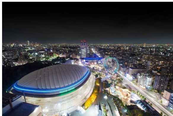
客室から見える絶景！ 東京ドームシティのイルミネーションイメージ

温かなホテル客室のプライベート空間でゆったりと過ごしながらか、窓の外に広がる色鮮やかに彩られた東京ドームシティのイルミネーションをお楽しみいただける宿泊プランをご用意。本プランには遊園地の乗り物1回券がお一人様につき2枚ついておりますので、この時期限定の幻想的な夜景と共に、お好きなアトラクションをご満喫いただけます。