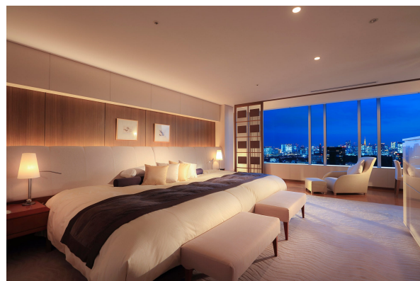
「ロイヤルドームスイート」ベッドルーム

フォーマルな中にも家庭的な温かさを感じさせる室内は、オフホワイトの布張りのソファやダークブラウンの木目の家具など、落ち着いた雰囲気にあふれています。ベッドはハリウッドツインタイプをご用意。バスルームの床には大理石を用い、木製デッキで囲まれたジャグジーからは都心の摩天楼や皇居、遠く富士山まで見渡すことができます。