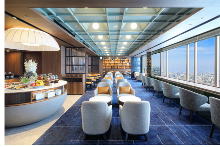
「エグゼクティブラウンジ」