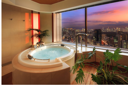
「ロイヤルドームスイート」バスルーム