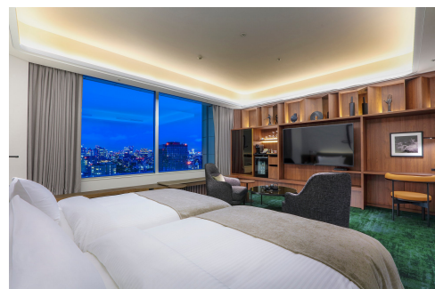
「エグゼクティブスイート C」

お問い合わせ：宿泊予約 TEL.03-5805-2222（9:00～19:00）